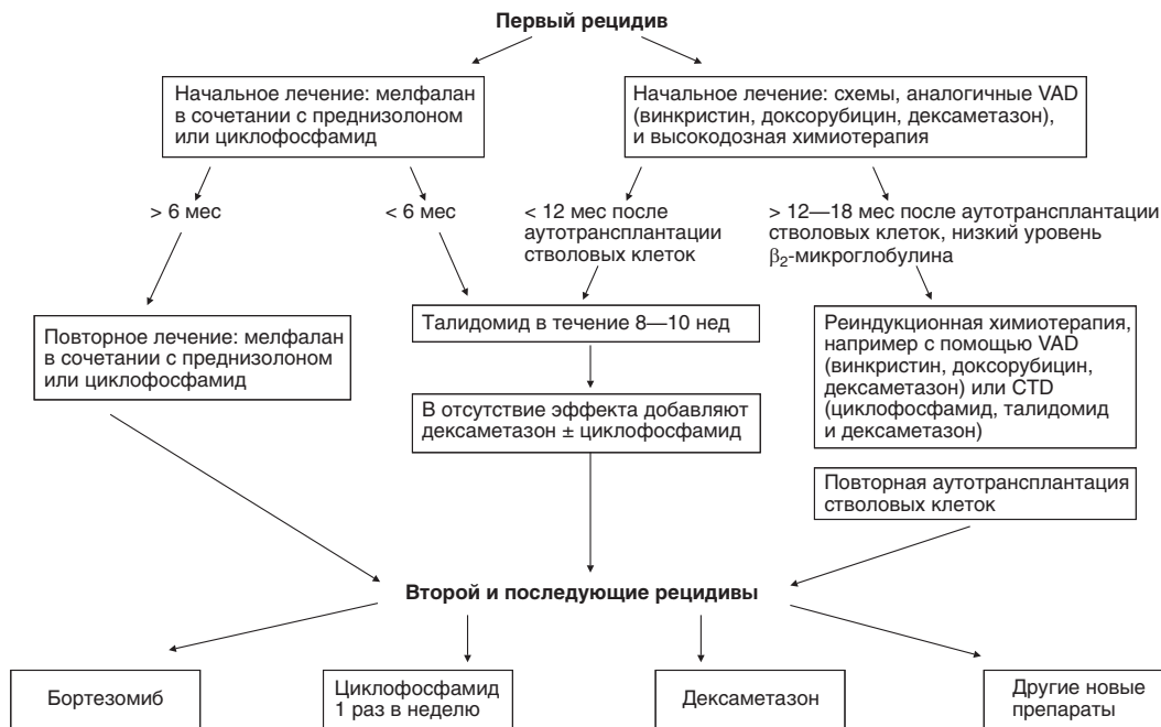
Рисунок 2. Тактика лечения при рецидиве.

670 больных, бортезомиб оказался эффективнее дексаметазона (Richardson et al., 2004). Медиана безрецидивного периода составила 7,6 и 3,2 мес, годовая выживаемость — 89 и 72%, частота полных и частичных ремиссий — 45 и 26% соответственно.