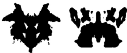
Рисунок 16.2. Пятна Роршаха.

Вклад объективного и субъективного компонентов может быть различным; чем больше дефицит объективной информации об образе, тем большую роль играет апперцепция. На этом основаны апперцепционные тесты, например тест чернильных пятен (тест Роршаха). В этом тесте на листок бумаги капают чернилами, затем этот листок складывают и разгибают; получается симметричная картинка (рис. 16.2). Человека просят рассказать, что он видит на этой картинке; поскольку на ней не изображено ничего, воспринимаемый человеком образ является почти чистой апперцепцией, и опытный психолог может по рассказу пациента распознать его настроение, мысли и ожидания.